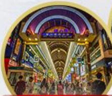
ช้อปปิ้งทานุกิโคจิ