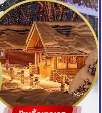
นิงเกิ้ลทอเรส