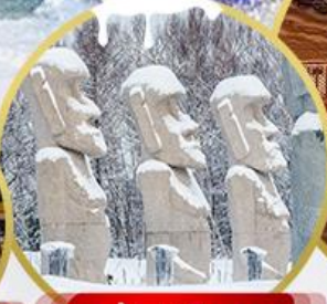
รูปปั้นหินโมอาย