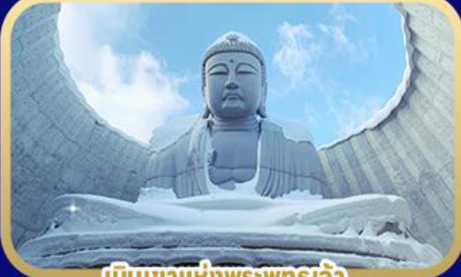
เป็นเขาแห่งพระพุทธรเจ้า